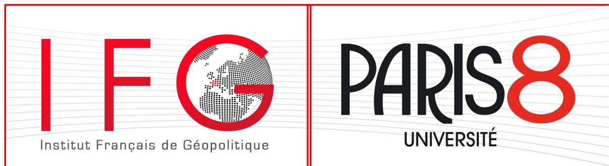
El logo del Instituto Francés de Geopolítica

Todo la formación se realiza en un Instituto. Alrededor de 140 estudiantes trabajan en el Instituto Francés de Geopolítica. Este Instituto propone 2 Master : un profesional y un otro de investigación. Los dos me interesa. Para el master profesional, los estudios son centrados sobre los problemas de geopolíticas locales, generalmente con un estudio sobre un país en particular. El master de investigación tiene campos de estudio más ancho, sobre estudios en geopolítica entre diferentes países del mundo.