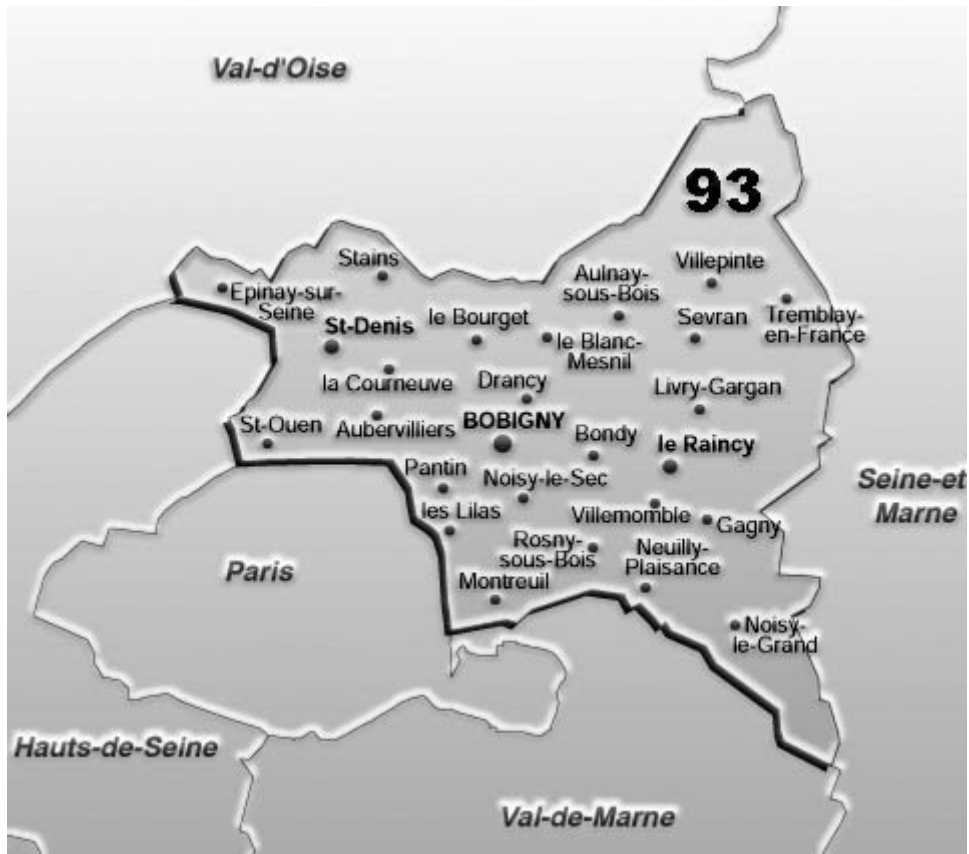
El departamento de Saint-Denis