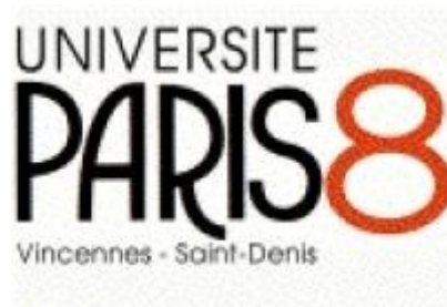
El logo de la universidad Paris 8

La Universidad Paris 8 es una universidad pública. Su fecha de fundación es el primero de enero de 1969. También, Paris 8 se llama “Université de Vincennes”.