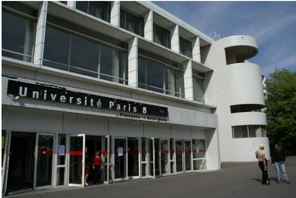
Una de las entradas de la universidad