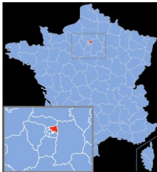
Localización del departamento de Saint-Denis en Francia

La Universidad de Paris 8 se sitúa en el Campus de la ciudad de Saint-Denis, cerca de París, al norte, a 9 km de Notre-Dame, en el departamento de la Seine-Saint-Denis . Los habitantes del ciudad de Saint-Denis se llaman " Dionysiens ". Este ciudad tiene una población alrededor de 100 000 habitantes. Esta población tiene una diversidad muy fuerte. Es una ciudad animada con los mercados y muchos festivales.