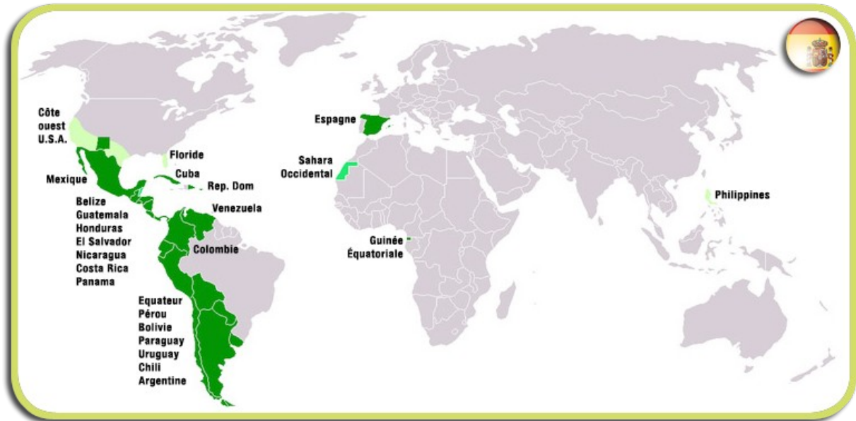
Mapa de los países hispanohablantes en el mundo