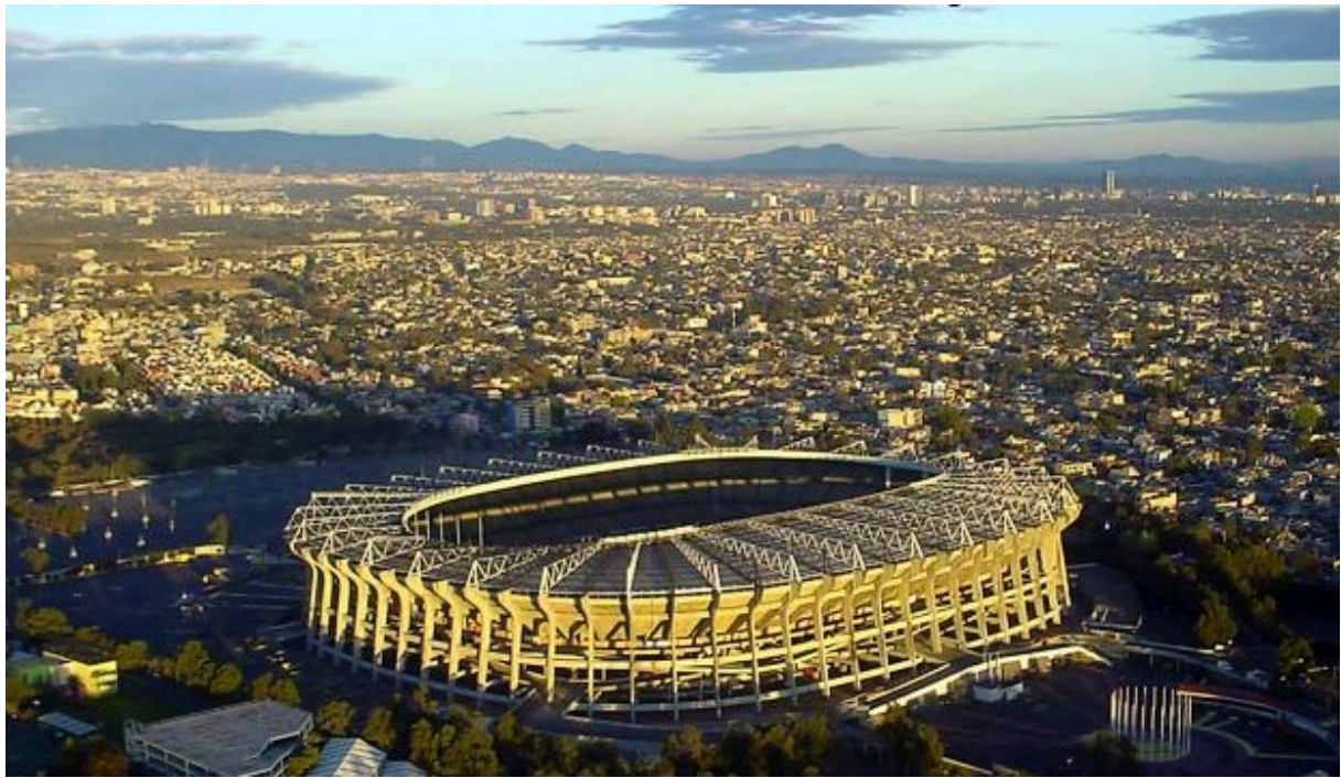
Foto del Stade de France y al fondo de la Ciudad de Saint-Denis

No hay que esconderse que la ciudad de Saint-Denis conoce una mala reputación a causa de importante tráfico de drogas y de numerosas agresiones. Sin embargo, el campus de la universidad no se sitúa en el corazón de la ciudad de Saint-Denis sino en el norte de esta última. Así, los estudiantes de París 8 están al lado de estos problemas lo que permite estudiar en buenas condiciones.