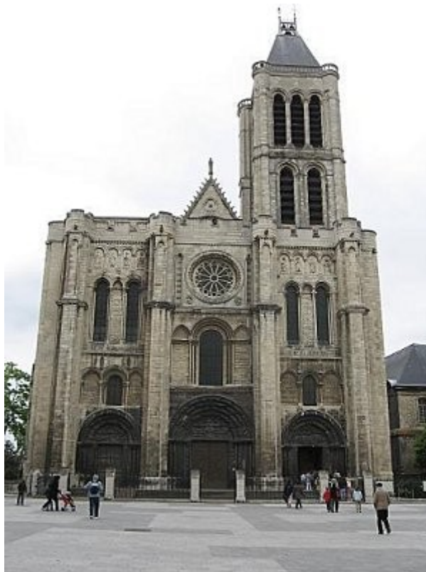
Basílica de Saint-Denis

Saint-Denis tiene una historia muy importante. Saint-Denis es la primera basílica construida en el siglo VII. Primer edificio del arte gótico y la necrópolis real, recibió las dinastías de los reyes de Francia. Es también, a la sombra de la Basílica, la Cámara de la educación de la Legión de Honor creada por Napoleón en los edificios de la antigua abadía. Todavía es el museo de arte e historia, en la antigua Carmen Luisa de Francia. Es también uno de los sitios más grandes de la Edad Media francés, un estudio realizado por el departamento municipal de arqueología ha trazado la evolución de la ciudad, encarnada por un recorrido histórico que va de la Basílica a la creación del Stade de France.