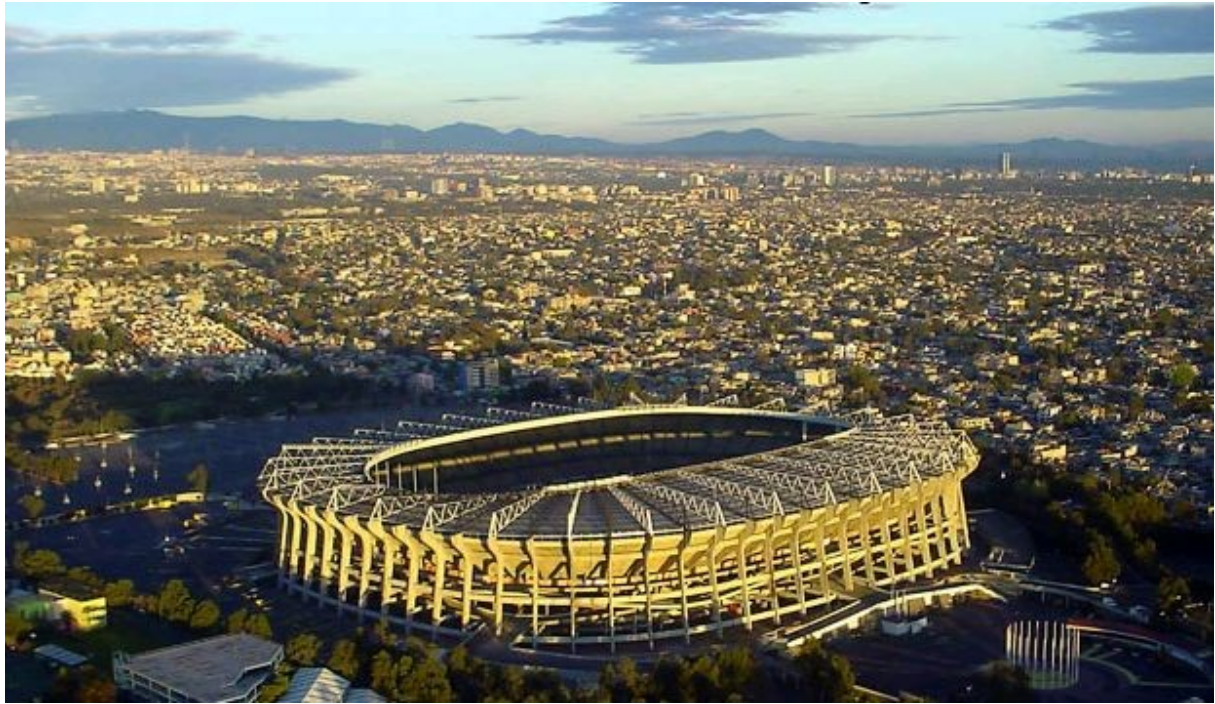
Foto del Stade de France y al fondo de la Ciudad de Saint-Denis

No hay que esconderse que la ciudad de Saint-Denis conoce una mala reputación a causa de importante tráfico de drogas y de numerosas agresiones. Sin embargo, el campus de la universidad no se sitúa en el corazón de la ciudad de Saint-Denis sino en el norte de esta última. Así, los estudiantes de París 8 están al lado de estos problemas lo que permite estudiar en buenas condiciones.